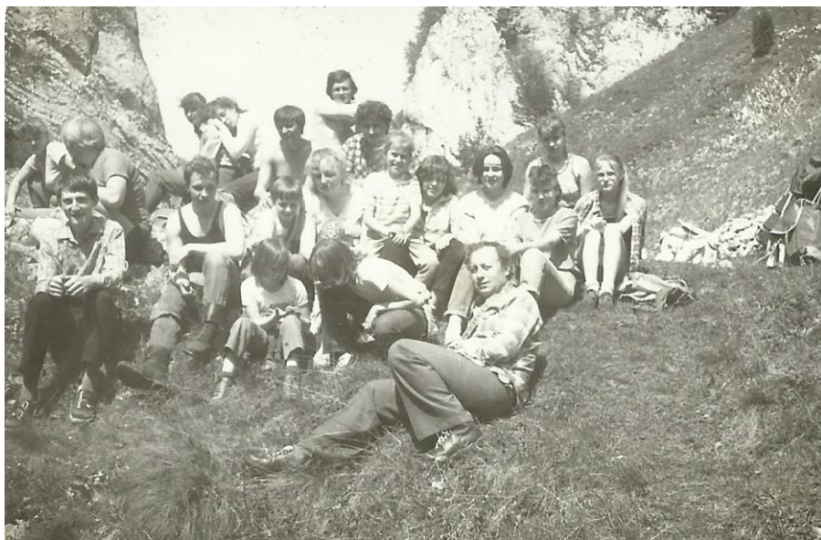
1988 – Manínská úžina, výlet mládeže