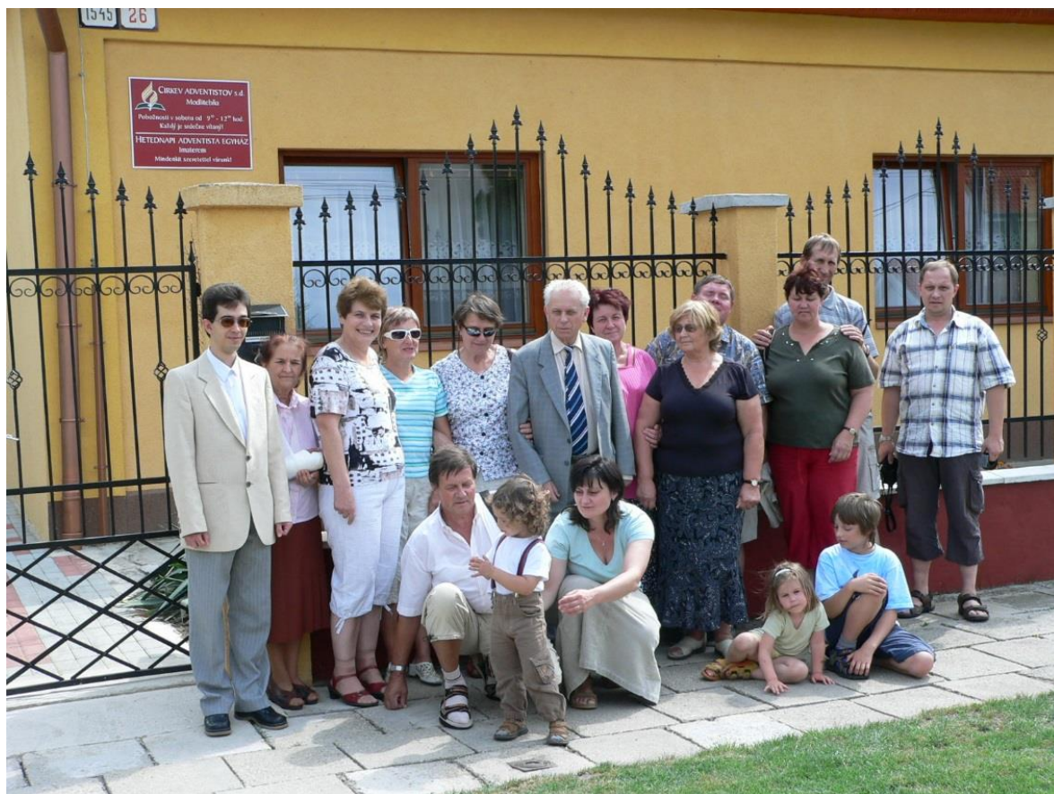
Křesťanský domov Slovensko 2008