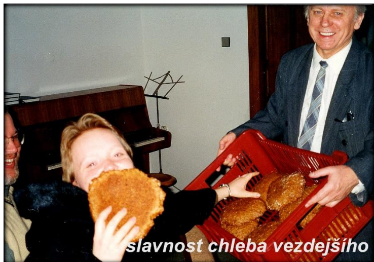
slavnost chleba vezdejšího

nejrůznějších zajímavostí souvisejících s nejzákladnější potravinou, ale mohli i celou řadu upečených chlebů ochutnat. Nemohly samozřejmě chybět ani zmínky a naučení ze