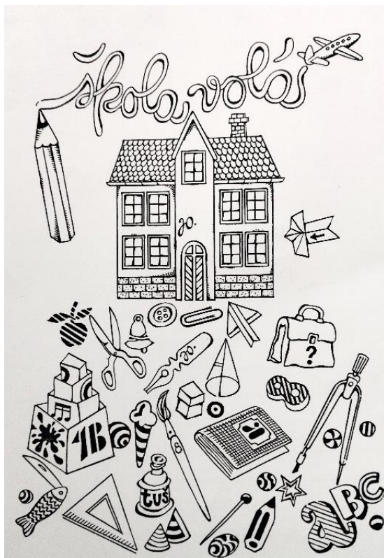
ilustrační kresba jindřichtolesť