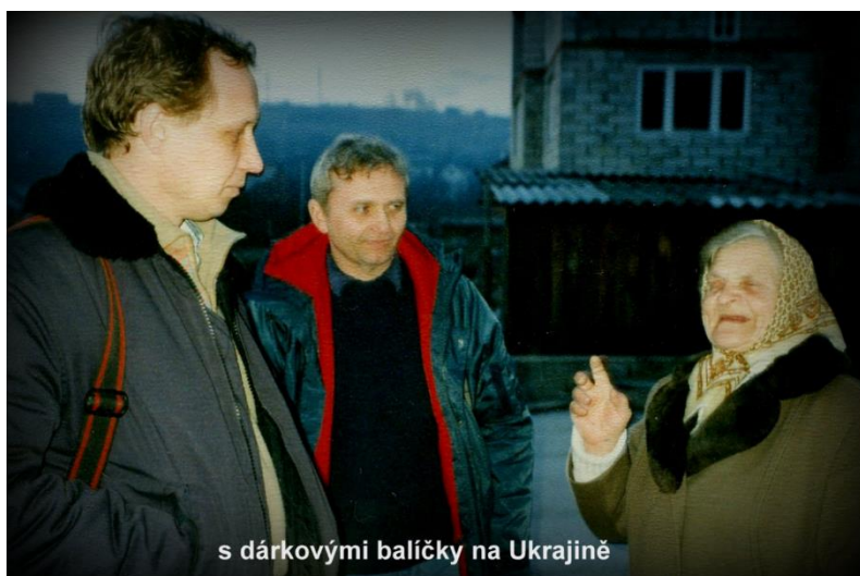
s dárkovými balíčky na Ukrajině