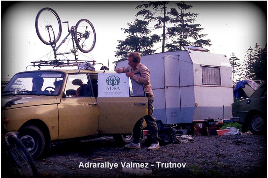
Adrarallye Valmez - Trutnov